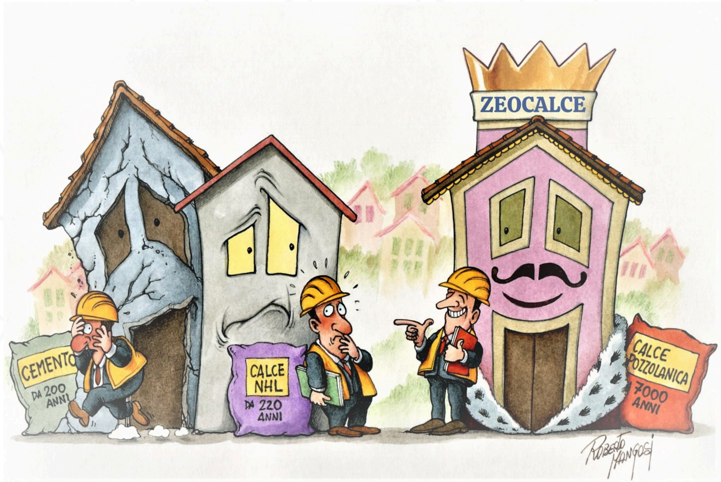
Ideazione Stefano Lancellotti - 2026